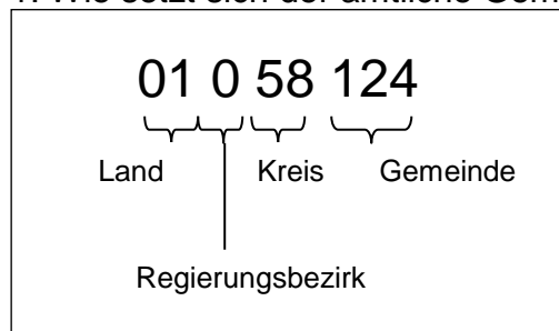
Abbildung 1: Wie setzt sich der amtliche Gemeindeschlüssel zusammen?

Ausnahme Rheinland-Pfalz: hier lautet die Gliederung: Land, Regierungsbezirk, Kreis, Verbandsgemeinde, Ortsgemeinde. Beispiel: 07 1 31 001 = Landkreis Ahrweiler, Verbandsgemeinde Adenau. In Rheinland-Pfalz wurde auf Grund der vielen kleinen Ortsgemeinden (ca. 2300) Anfang der siebziger Jahre die Ebene der Verbandsgemeinden (ca. 210) eingeführt, die für die Ortsgemeinden die Verwaltung durchführen. Auswertungen auf Ortsgemeindeebene sind für Rheinland-Pfalz aus Geheimhaltungsgründen nicht vorgesehen. Die Struktur der Verbandsgemeinden ist auch größenmäßig mit Gemeinden in anderen Bundesländern vergleichbar. Verbandsfreie Gemeinden und Städte weisen an der Stelle der Verbandsgemeinde die Ziffern 000 auf. Da in einigen Landkreisen mehrere